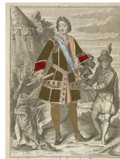
Пётр I, 1717г.

кофе и курить трубку. То есть стараться быть похожими на него самого. Право на ношение бороды можно было выкупить, заплатив специальный налог.