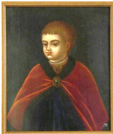
Цесаревич Пётр в детском возрасте

Пётр I был самым крепким из детей Алексея Михайловича Романова, обладал замечательным здоровьем и ростом больше двух метров. Но одежду носил 48 размера, а обувь всего лишь 38-го.